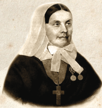
Бакунина Екатерина Михайловна 1810 - 1894

РОССИЙСКАЯ СЛАВА ПЛВЕРСКОГО ДВОРЯНСТВА К 200 - летию со дня рождения