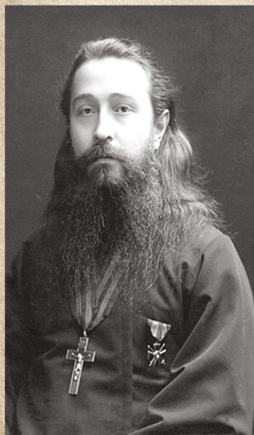
Архимандрит Сергий Сребрянский