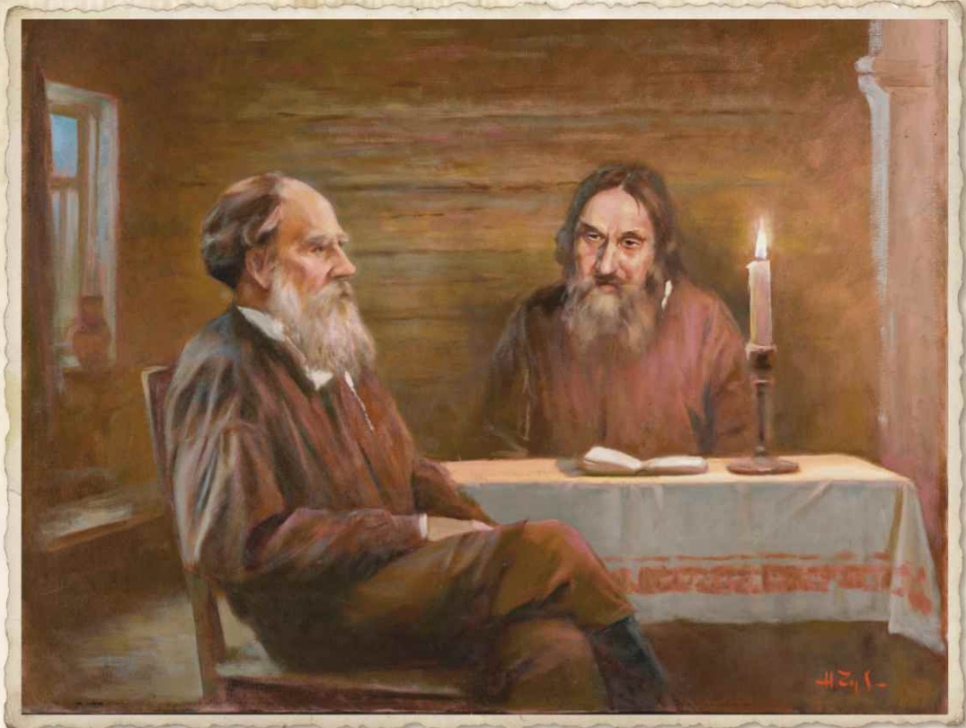
Л.Н. Толстой в гостях у Василия Сютяева в 1881 г.

Сюжетные картины и портретная галерея выставочного проекта «Лев Толстой и Тверской край: от бастионов Севастополя до дворянских имений на Тверской земле» созданы заслуженным художником России Николаем Николаевичем Чувахиным (г. Тверь)