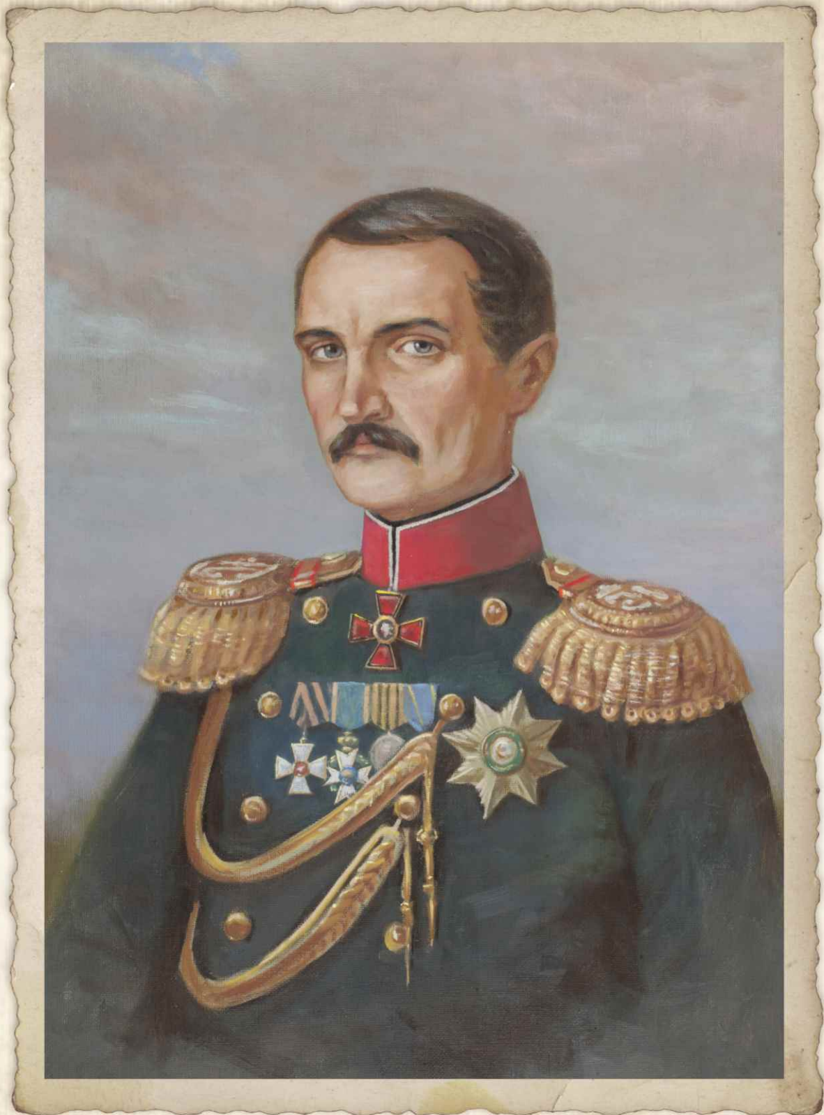
Вице-адмирал Владимир Алексеевич КОРНИЛОВ