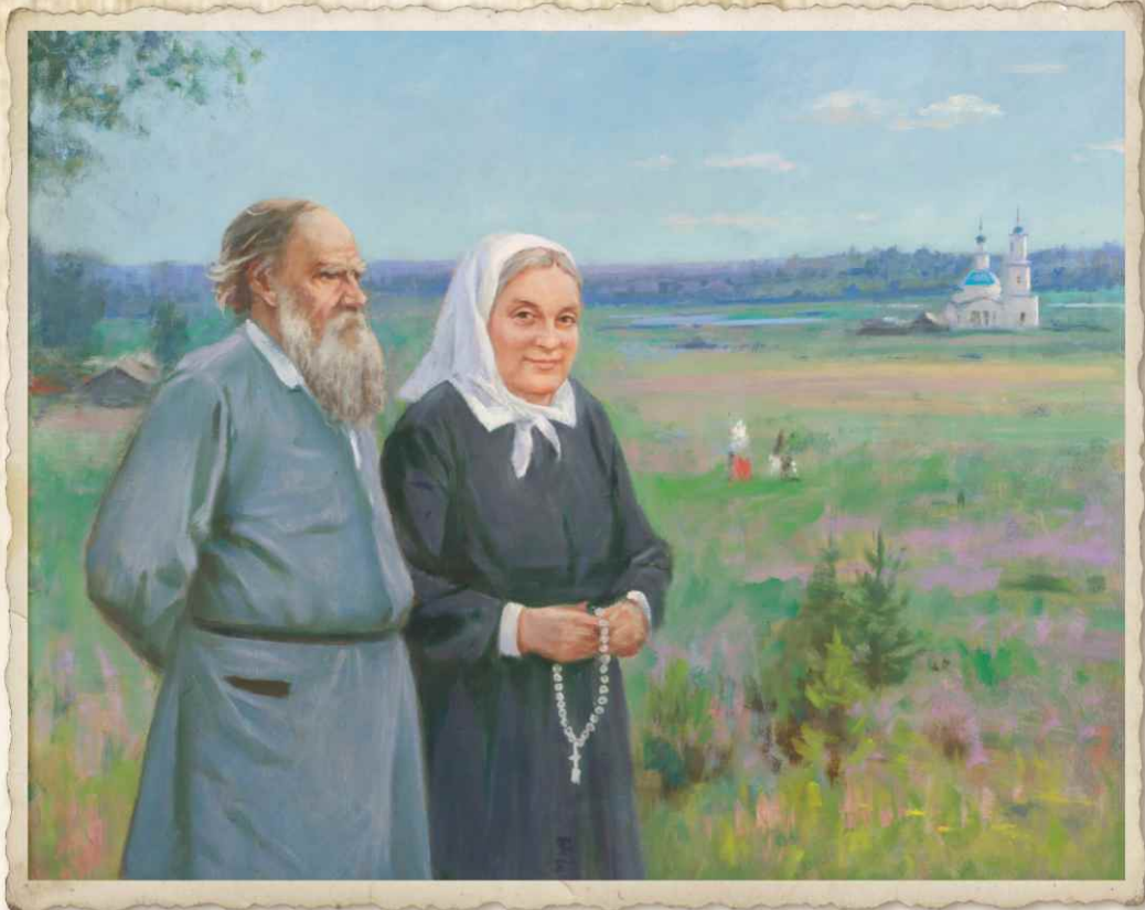
Лев Толстой и Екатерина Бакунина в Казицыно в 1881 г.