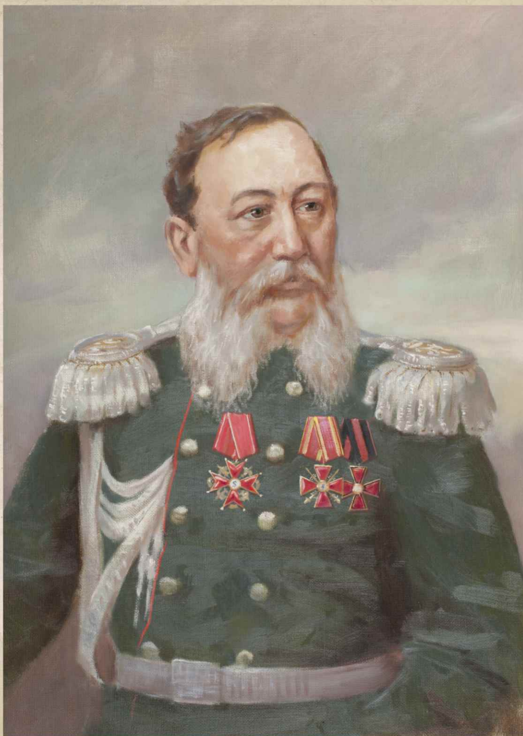
Генерал-лейтенант Петр Кононович МЕНЬКОВ