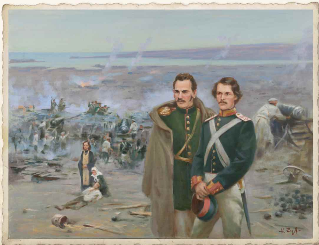
Подпоручик Лев Толстой и унтер-офицер Тобольского пехотного полка Александр Бакунин в Севастополе в 1855 г.