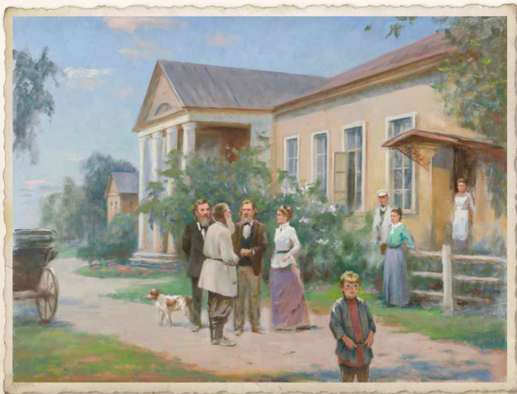
Приезд Л.Н. Толстого в Прямухино осенью 1881 г.

Сюжетные картины и портретная галерея выставочного проекта «Лев Толстой и Тверской край: от бастионов Севастополя до дворянских имений на Тверской земле» созданы заслуженным художником России Николаем Николаевичем Чувахиным (г. Тверь)